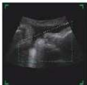
Display an ideal 2D image and perform sampling

A diferencia de la operación complicada en la imagenología por ultrasonido 4D tradicional, el CTS-8800 adopta un método de operación simple y rápida. Sólo con unos pocos pasos sencillos, se pueden obtener fácilmente imágenes de ultrasonido en 4D.